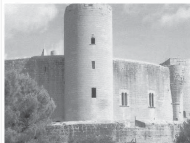
Palatul Bellever (Majorca, sec. XIV)

Obiectul de studiu al castelologiei comparate îl constituie evoluția arhitecturii militare, privită prin prisma surselor, influențelor și paralelismelor. În grupul categoriilor esențiale vor intra sursele (primare, secundare, interne, externe, ș.a.), influențele (directe, indirecte), „emițătoarele”, „transmițătoarele” și „receptorii” influențelor, paralelismele istorice (sincrone) și anistorice (asincrone), rezistențele la influențe și replicile creatoare. Studiarea acestora contribuie la evidențierea unor constante – aspecte ale unificării