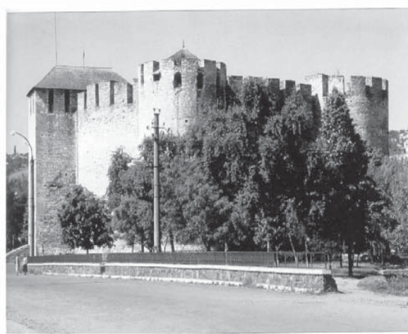
Cetatea Soroca (Moldova, sec. XVI)